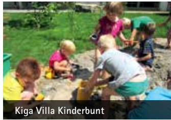
Kiga Villa Kinderbunt