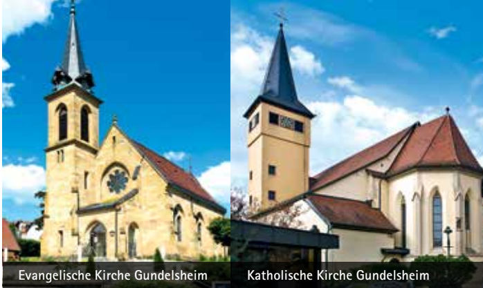
Evangelische Kirche Gundelsheim