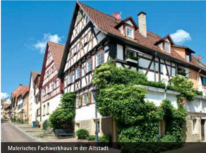
Malerisches Fachwerkhaus in der Altstadt

Die Bachenauer, so heißt es im Lagerbuch 1554, pfarren gen Duttonberg; erst 1878 erhalten sie eine ständige Pfarrei. 1901/02 wurde eine neuromanische Kirche erbaut, in die man den Turm des Vorgängerkirchleins einbezogen hat.