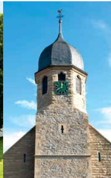
Katholische Kirche Obergriesheim