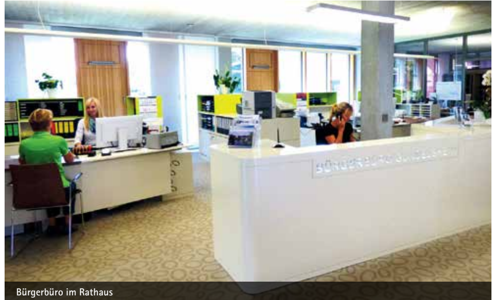
Bürgerbüro im Rathaus