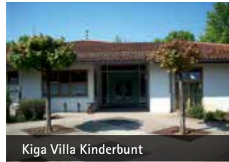
Kiga Villa Kinderbunt