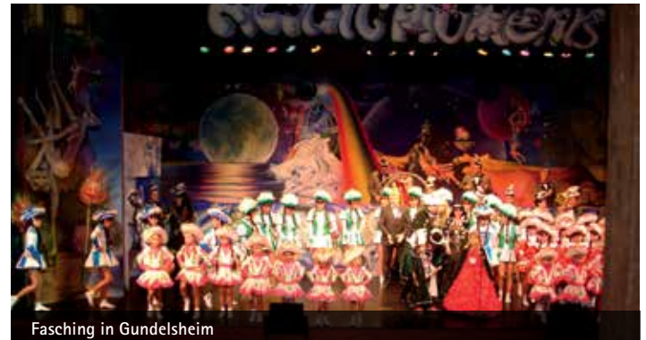
Fasching in Gundelsheim