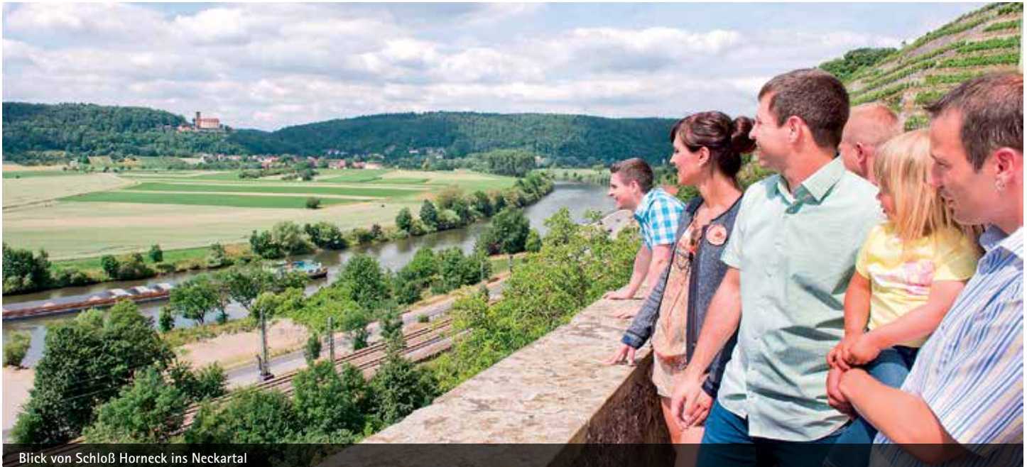
Blick von Schloß Horneck ins Neckartal