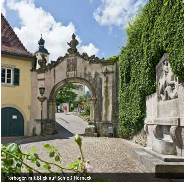
Torbogen mit Blick auf Schloß Horneck