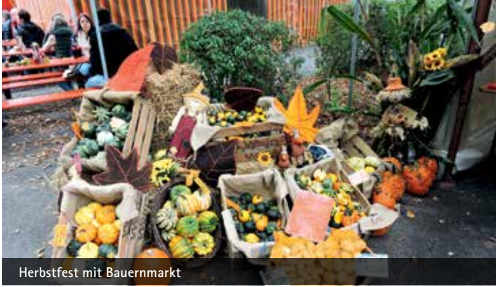
Herbstfest mit Bauernmarkt