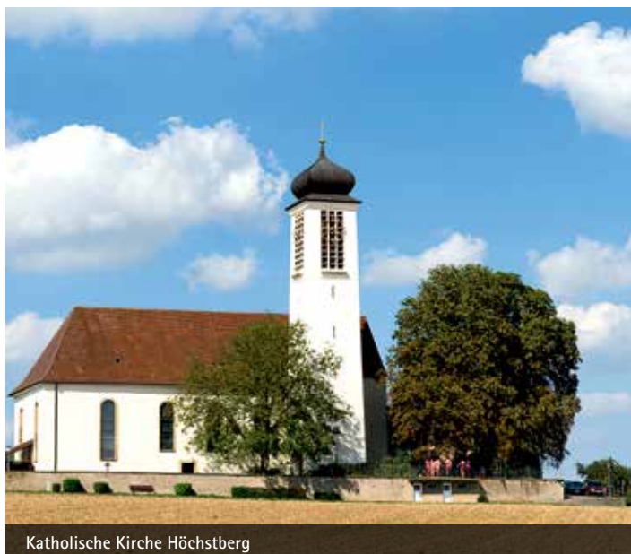
Katholische Kirche Höchstberg