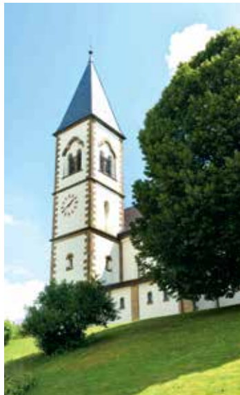
Katholische Kirche Tiefenbach