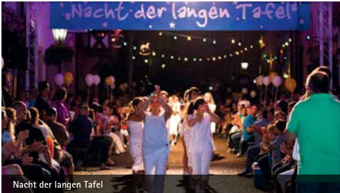
Nacht der langen Tafel