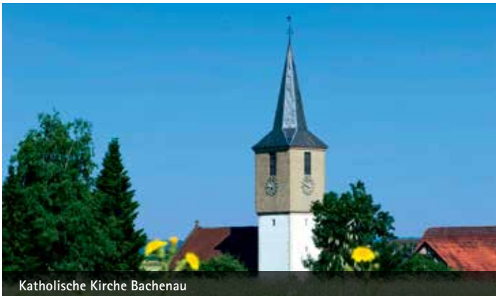
Katholische Kirche Bachenuau